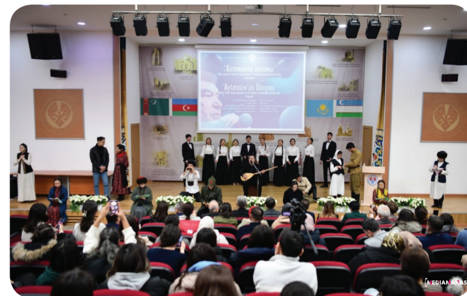
КАБАР: МЕДИАМАНАС / ФОТО: МЕДИАМАНАС

Иш-чара университеттин көркөм өнөр факультети, гуманитардык жана коммуникация факультети тарабынан уюштурулду. Мындан тышкары университеттин кинозалында жазуучунун чыгармаларынан тартылган көркөм фильмдери көрсөтүлдү жана студенттер тарабынан уюштурулган эскерүү кечелери да өттү.