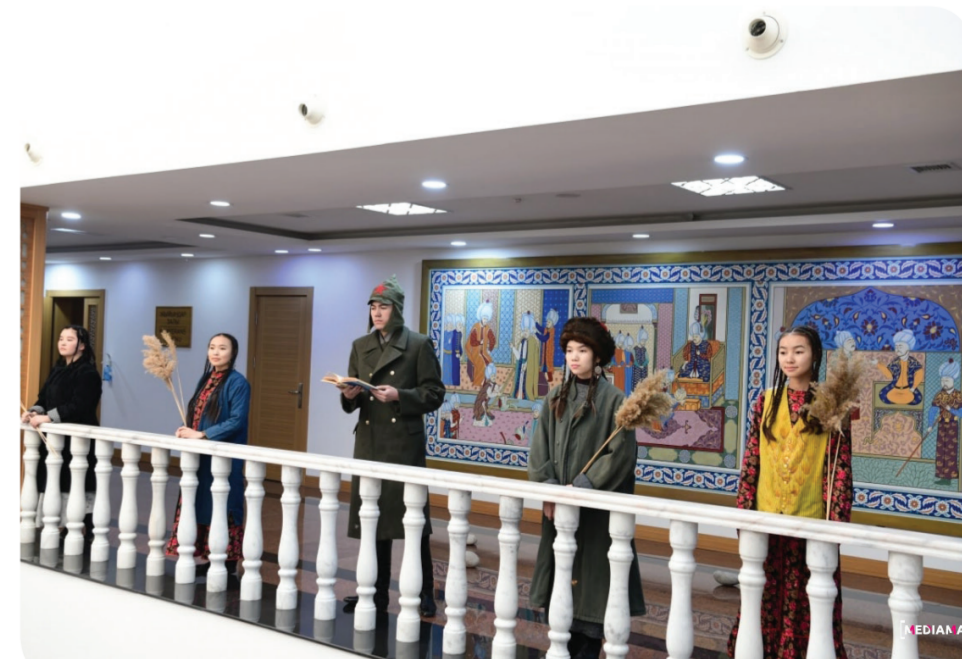
КАБАР: МЕДИАМАНАС / ФОТО: МЕДИАМАНАС