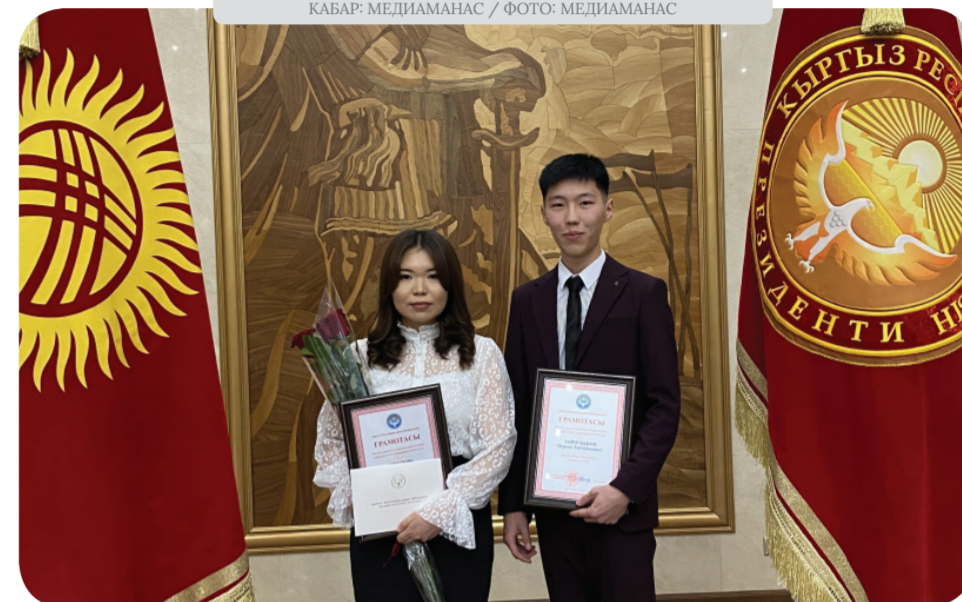
КАБАР: МЕДИАМАНАС / ФОТО: МЕДИАМАНАС

КТМУнун ректораты жана жалпы жамааты президенттик стипендияга татыктуу болгон студенттерди куттуктап, окууларына мындан ары да ийгиликтерди каалайт.