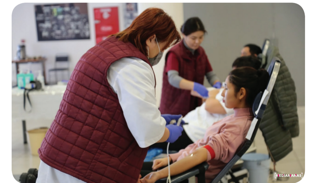
КАБАР: МЕДИАМАНАС

Кыргыз-Түрк “Манас” университетинде 6-8-декабрь күндөрү “Сиздин каныңыз бир өмүрдү сактайт!” урааны менен кан донору болууга үндөгөн акция өттү. Иш-чара кандын запасын топтоо максатында Республикалык кан куюу борбору менен бирге уюштурулду.